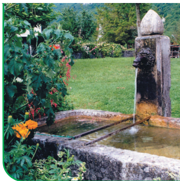
Fontaine fleurie à Nances.

Cette commune correspond à une très ancienne paroisse qui s'est toujours appelée Nances car ce nom est d'origine celtique. Peuplée de près de 400 habitants, elle étage de nombreux hameaux entre la montagne de l'Épine et le lac d'Aiguebelette. Ces hameaux sont fleuris et offrent de belles promenades. Le chef lieu mérite le détour avec sa mairie, son presbytère et l'église. Cette dernière a été construite en 1877-1878 à l'emplacement de l'ancienne église dont elle a conservé le bénitier et deux portails du XVème siècle.