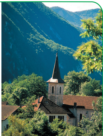
Chef lieu de Nances.

s'écoulait par le seuil de la porte. Lors des périodes de sécheresse, les habitants du village allaient en procession à cette chapelle pour demander la pluie. Des fresques à l'intérieur de la chapelle représentent la rose églantine, symbole de la Vierge Marie et quatre scènes d'eau dans la Bible: Moïse faisant jaillir l'eau du rocher; Elie montant à la montagne du Carmel pour obtenir la pluie, le Christ baptisé par saint Jean-Baptiste, la Samaritaine étonnée de l'eau que lui propose le Christ, source d'eau vive.