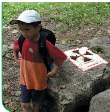
Croix de malte

L'historique du nom vient d'une congrégation des hospitaliers de St-Jean ou frères de l'hôpital St-Jean de Jérusalem fondée au 10ème siècle. Vers 1530, elle obtint la possession de l'île de Malte et prit le nom des chevaliers de Malte. Cette congrégation érigée en commanderie avait beaucoup de possessions dans la région. Les paysans locaux détenaient des baux de longue durée pour cultiver les terres de la commanderie. Ces terres étaient délimitées par des bornes de pierre sculptées de Croix de Malte que l'on retrouve le long des sentiers.