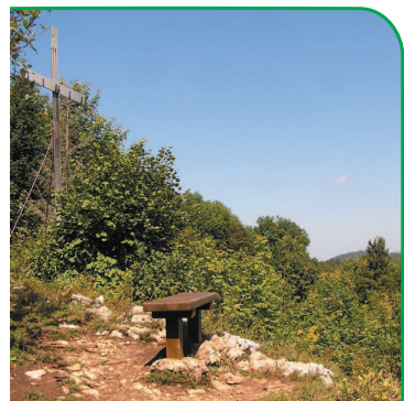
La croix du Signal