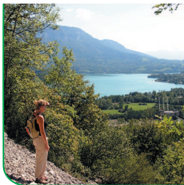
Vue depuis les Balmes

Avec une surface de 540 hectares et une profondeur maximum de 70 mètres, il s'agit du troisième lac naturel français. Utilisé pour l'alimentation en eau potable et la production d'électricité, la qualité de ses eaux a fait sa réputation et l'un de ses principaux attraits. Haut lieu pour les activités de loisirs (pêche, baignade...) et la pratique de l'aviron, le site a su conserver son authenticité et préserver son environnement. Entouré de plus de 70 hectares de zones humides protégées, il constitue un patrimoine naturel remarquable qui a fait l'objet de nombreuses mesures de protection.