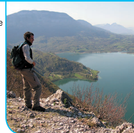
Vue sur le lac d'Aiguebelette