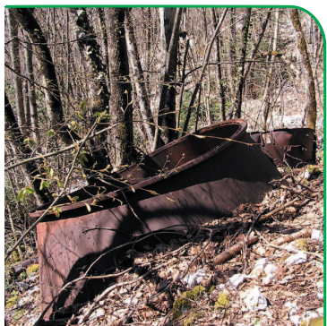
Anciens "fours", vestiges de la fabrication de charbon de bois.

Les vestiges de la fabrication du charbon de bois présents dans la montagne datent de la guerre de 39-45. Des bûcherons et maquisards fabriquaient ce charbon pour alimenter les véhicules qui fonctionnaient alors au gazogène (gaz issu du charbon de bois) faute d'essence. Dès l'arrivée des allemands en juin 1940, les pompistes avaient ouvert les vannes, laissant s'écouler l'essence plutôt que de la laisser à la disposition des allemands. Les bûcherons déjeunaient à la cantine des Villas Dorias (hameau en ruine sur la route du col de l'Épine).